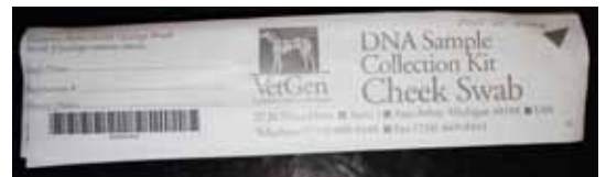
3 étuis de brosse